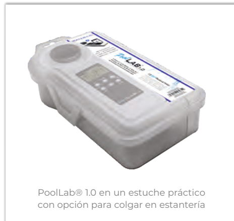
PoolLab® 1.0 en un estuche práctico con opción para colgar en estantería

El PoolLab® 1.0 dispone de Bluetooth® y, por tanto, puede conectarse al software y la aplicación gratuitos LabCom® para sincronizar los resultados de las pruebas por cuenta, imprimir informes e incluso recibir recomendaciones de dosificación basadas en los productos de cuidado del agua introducidos individualmente. El cálculo del índice LSI también se ofrece a través del software y la aplicación. Un servicio gratuito en la nube – si se desea – garantiza que el software y la aplicación funcionen siempre con datos sincronizados.